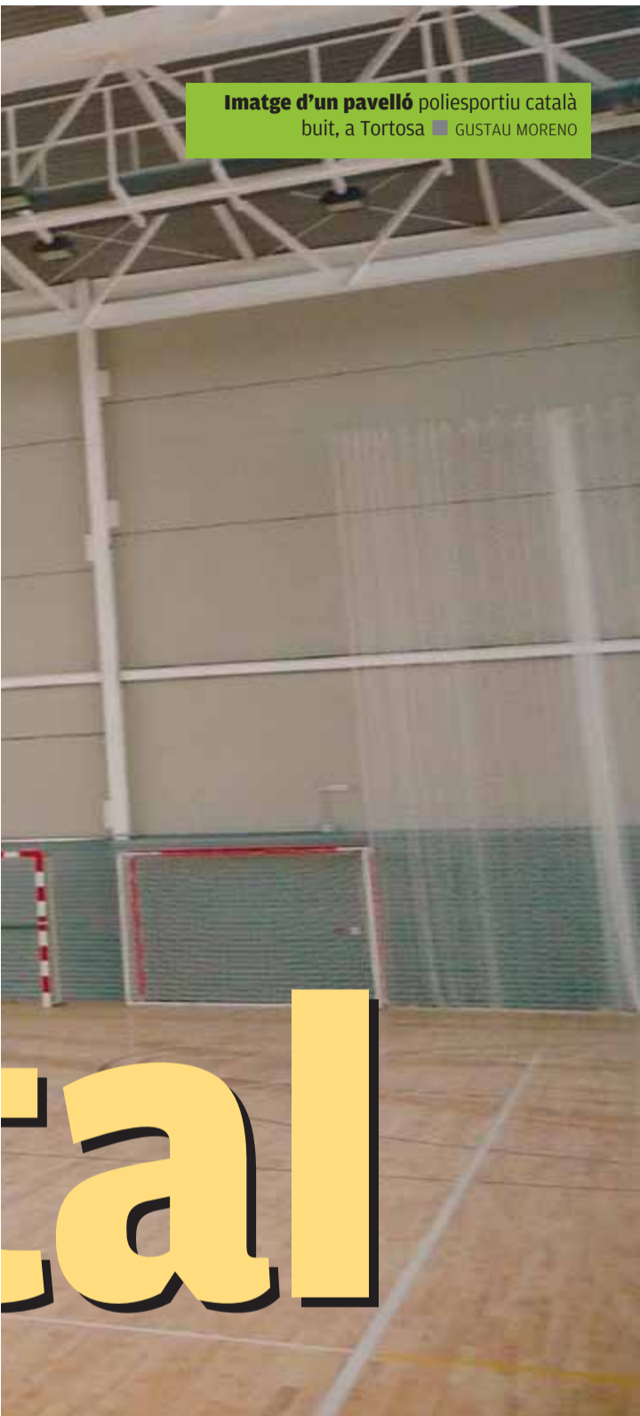
Imatge d'un pavelló poliesportiu català buit, a Tortosa ■ GUSTAU MORENO